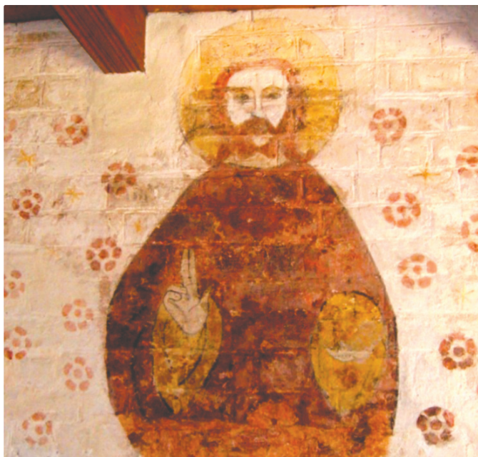
Frelserens Højde i Vigersted Kirke.