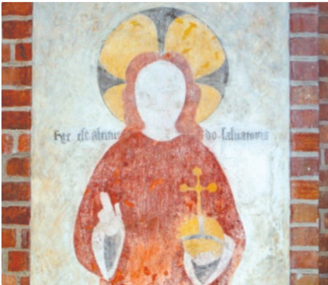
Frelserens Højde i Sct. Bendts Kirke.

Kun to andre kirker i Danmark er et lignende kalkmaleri af Frelserens Højde registreret: Sct. Bendt Kirke Ringsted, som dateres til omkring 1400 og i Vigersted Kirkes våbenhus, dateret til 1450-75.